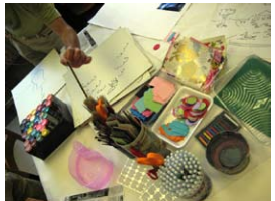
Multitud de materiales pueden utilizarse en el taller