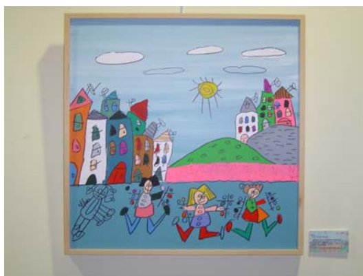
Wedding and Holy Communion invitations

Ti produkti so predstavljeni na manjših razstavah v okolici z namenom, da se širi dejavnost in njeni rezultati.