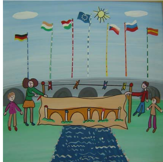
Malerisch aktiv sein führt zu: Kreativität in Kommunikation und Integration