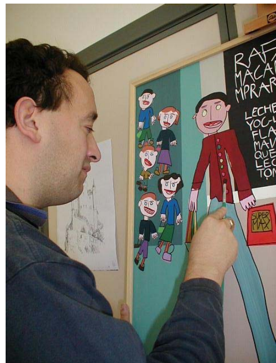
Autistische Menschen mit Erfahrung können als Mentoren fungieren

Der Raum ist offen, so dass jeder Teilnehmer mit Autismus auswählen kann, wo er arbeiten möchte je nach seinen Vorlieben, den Ansprüchen der