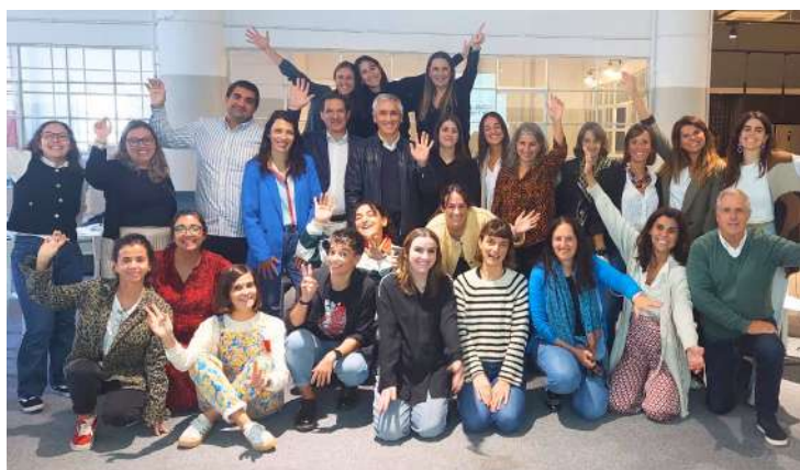
PARTICIPAMOS NOS WORKSHOPS DA MAZE E IMPACT HUB A CONVITE DA NOVA-SBE

O primeiro workshop, foi dinamizado pela equipa da MAZE, proporcionando uma visão geral sobre o universo dos investimentos nos setores social e híbrido em Portugal. O segundo foi conduzido pelo Impact Hub e focou-se nas melhores práticas de apresentação e elementos essenciais que devem estar presentes num pitch. Estes dois workshops serviram de preparação para o para o evento final do programa Social Leap Frog - o Frog Tank.