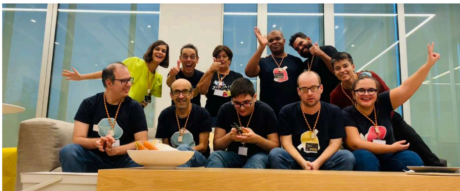
OS THE ZIGUAIS ATUARAM NO EVENTO CAIXA SOCIAL E NO ANIVERSÁRIO DO CAFÉ JOYEUX NA COFIDIS.